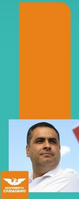
Alfredo "Caballo" Lozoya Movimiento Ciudadano