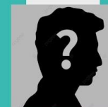
N/S Aún no decide