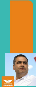
Alfredo "Caballo" Lozoya Movimiento Ciudadano